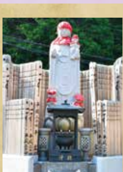
ご塔婆はお地藏様を囲み一年間建立しご供養致します

お盆のお詣りに伺わない方は同封の申込用紙に必要事項をご記入の上、茶色の返信用封筒(切手不要)にて御返送下さい。ご供養料は同封の郵便局の振込用紙にてご納金下さい。※年忌に当たらない仏様のご供養もできます。