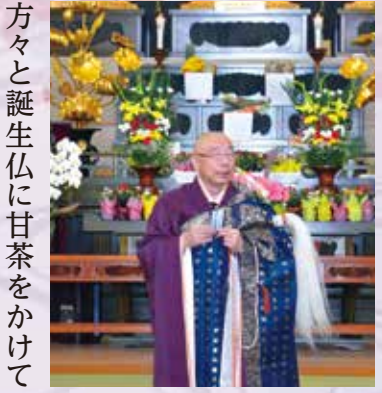
方々と誕生仏に甘茶をかけてお祝いを行い終始和やかな雰囲気の中で執り行われました。清元住職からコロナ禍、戦争と明るい話ばかりではないが、今こそ慈悲と知恵を分かち合い、仏教の教え、自分の命とともに他人の命をも大切に生きていく。そんな互いの思いと出会いへの感謝から正しく世を見つめたいものですと温かいお話しがありました。