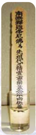
※十六日が終わりましたら水から出し、乾燥させて、二十日の法要に御持参頂くか、半紙等にくるみ、来年のお盆か、次の御命日の時に、お渡し下さい。

●お伺いの際に水向供養塔婆(水塔婆)をお持ち致します。口の広めのコップに、水を半分ほど入れ御用意下さい。水塔婆は十六日まで、毎朝水を取り替えること丁寧ですね。