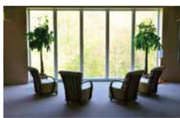
新納骨堂ご休憩所

駐車場から玄関入り口にかけて段差のないバリアフリー対応となっており、室内霊苑へはエレベーターで移動することができます。