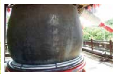
世界一の 大鑿 (だいきん)

国家の安泰、平和の成就を祈念し「国安平和の鐘」と呼ばれています。日本テレビ系列の「ゆく年、くる年」(平成2年除夜)をはじめ数々のテレビ放送で紹介されました。