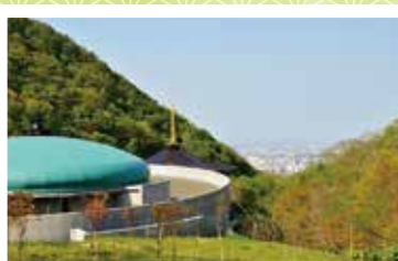
永代供養塔より眺める景色

札幌市街を一望できます。夜景と星空のコントラストにより心に残る景色を満喫頂けます。