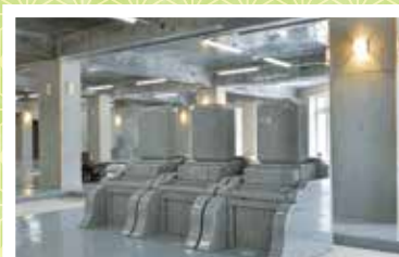
新宮の森霊園墓所

札幌市街を一望できます。夜景と星空のコントラストにより心に残る景色を満喫頂けます。